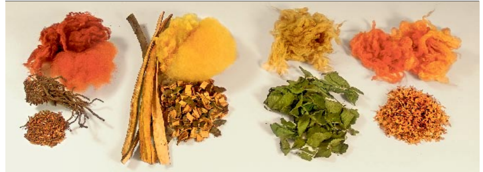
Aus der Krappwurzel entsteht ein warmes Rot.